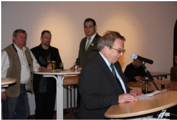
Präsident Franz-Josef Radmacher.