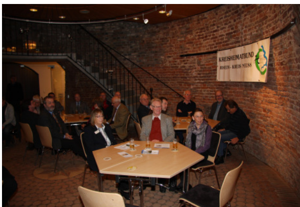
In der Teloymühle.