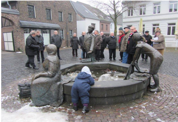
Führung durch Lank.